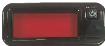
鏡頭蒐尋器 查找針孔鏡頭