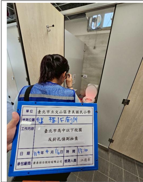
信義樓 1F 廁所