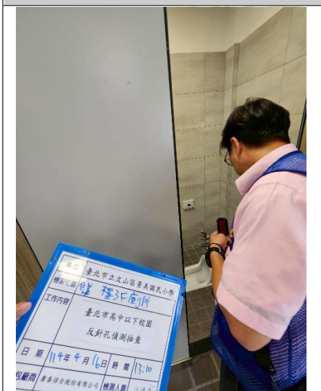
信義樓 3F 廁所