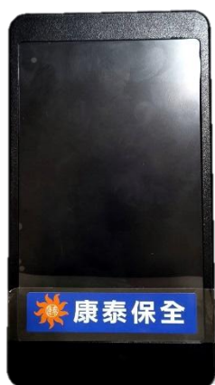
WiFi 網路訊號偵測器 WiFi 2.4G 行動裝置 熱點及藍芽掃描