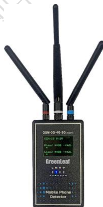
行動通訊訊號偵測器 偵測 3G、4G、5G 無線 隱藏攝影機