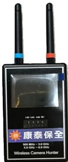
RF 類比訊號偵測器 50 米攔截類比無線訊號 影像