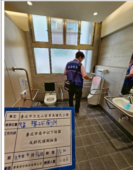
信義樓 2F 廁所