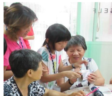
親子”跨世代服務”體驗