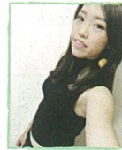
專業師資-咕咕街舞老師

對孩子很有一套方法，是一位會讓小寶貝都會愛上的老師，專業的教學活潑親切又有活力的妙妙，雙語幼兒園運動中心、舞蹈教室、醫學大學皆有授課是小寶貝成長中不可缺少的老師