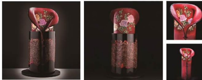
In the exhibition, more than 50 pieces of recent works by the artist are displayed, including "Lady Zhen". 2018 A' Design Award winner in the Arts, Crafts and Ready-Made Design Category.

本展覽展出50多件馮斯蒂女士近期作品，其中「瑰姿艷逸，儀靜體閑」，是今年度A' 設計大獎 從100個國家、地區，99個不同設計領域的「藝術工藝」類中，由極具國際影響力的知名學者、 媒體、設計人士和企業家組成的評審團，進行評鑑而獲得銅獎的作品。