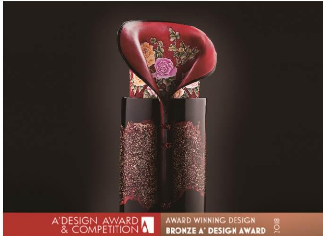
2017-2018 A' 設計大賽「藝術工藝類」銅獎 Bronze A' Design Award Winner In Arts, Crafts and Ready-Made Design Category, 2017-2018